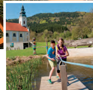
Mini Donau in Engelhartzell erforschen