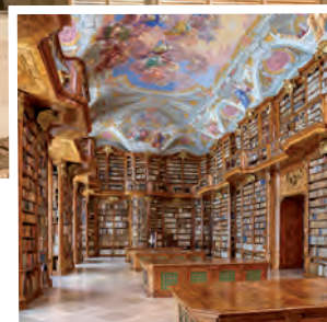
Stift St. Florian erkunden

Wer die Spuren der Römer selbst erforschen möchte, ist in der oberösterreichischen Donauregion genau richtig. In Enns , der ältesten Stadt Österreichs, bietet das Museum Lauriacum mit seiner neu gestalteten Schausammlung spannende Einblicke in das Leben der Römer. In Oberranna steht das am besten erhaltene römische Bauwerk Oberösterreichs, eine kleine, besondere Befestigungsanlage. Auch rund um die Schlögener Schlinge sind Römerspuren zu finden. Das Römerbad in Schlögen zeigt wie zur Zeit der Römer gebadet und entspannt wurde.