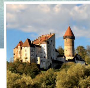
Burg Clam entdecken

Donau-Sagen und Geschichten erzählen vom Mythos Donau, der eng mit der Region und den Menschen, die hier leben, verbunden ist.